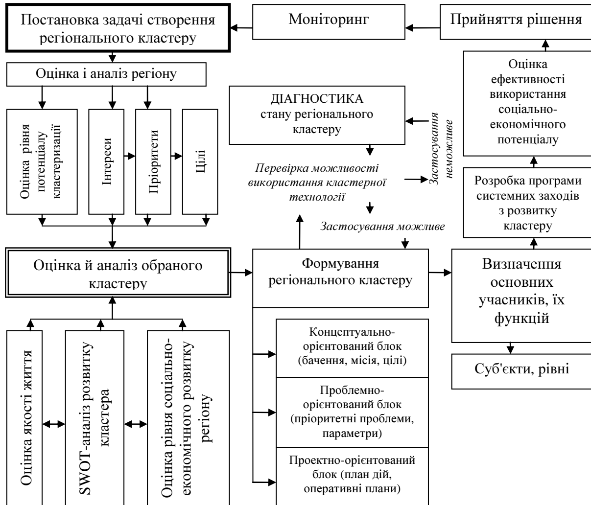
Рис. 2. Методика застосування результатуючих показників у процесі реалізації кластерної технології в регіоні

Соціальний кластер являє собою інтеграцію закладів і організацій соціальної сфери незалежно від організаційно-правових форм і форм власності на основі єдиних нормативів і стандартів застосування інноваційних інформаційно-комунікаційних технологій. Це складна багаторівнева, внутрішньо диференційована відкрита система, за допомогою якої формується сприятливе соціокультурне середовище і надаються соціальні послуги населенню [10]. Основними завданнями при цьому є: нарощування вартості нематеріальних активів, інтелектуальної власності в структурі активів підприємств і ВРП, розвиток інноваційної інфраструктури (лабораторно-дослідницької, впроваджувальної, фінансової, соціальної), формування системи кадрового забезпечення інноваційного процесу.