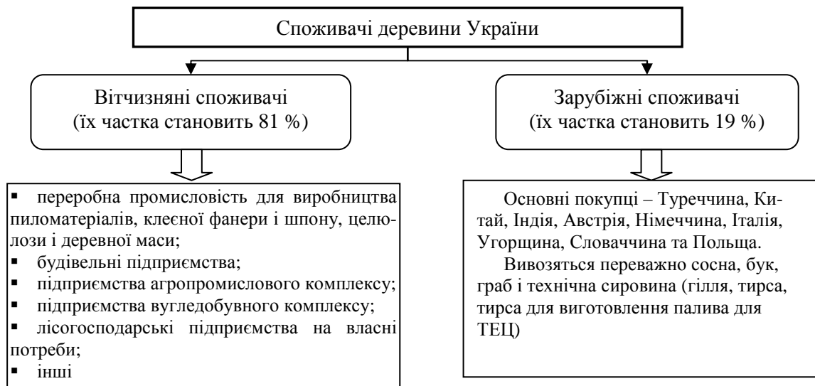
Рис. 2. Споживачі деревини України

Основні споживачі деревини наведені на рисунку 2. Найбільшими споживачами деревини в Україні є переробна промисловість для виробництва пиломатеріалів, клеєної фанери і шпону, целюлози і деревної маси та будівельний комплекс. На промислове та житлове будівництво витрачається близько 60 % пиловника та будівельного лісу. Серед зарубіжних споживачів найбільше купують деревину та вироби з неї представники таких країн, як: Туреччина, Китай, Індія та ін.