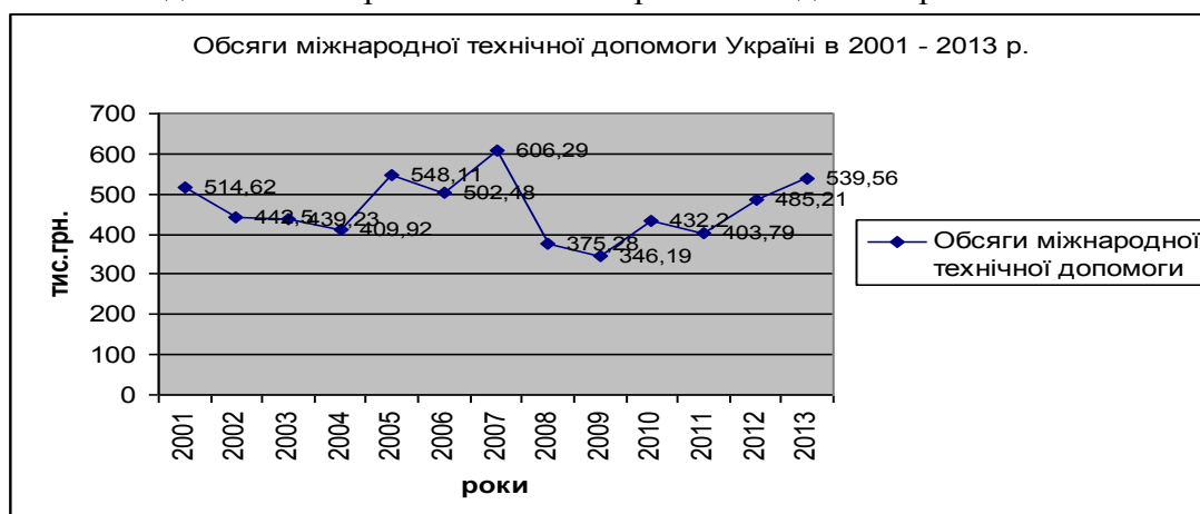
Рис. 2. Динаміка обсягів міжнародної технічної допомоги Україні в 2001-2013 рр. (складено за даними Міністерства економічного розвитку і торгівлі України)

Водночас відбувається і практична реалізація договорів про міжнародну технічну підтримку, механізм реалізації яких встановлений чинною нормативно-правовою базою. Так, у Постанові Кабінету Міністрів України від 15 лютого 2002 р. № 153 «Про створення єдиної системи залучення, використання та моніторингу міжнародної технічної допомоги» зазначається, що міжнародна технічна допомога – це ресурси та послуги, що відповідно до міжнародних договорів України надаються донорами на безоплатній та безповоротній основі з метою підтримки України [8]. Динаміка обсягів міжнародної технічної допомоги Україні в 2001-2013 роках наведена на рис. 2.