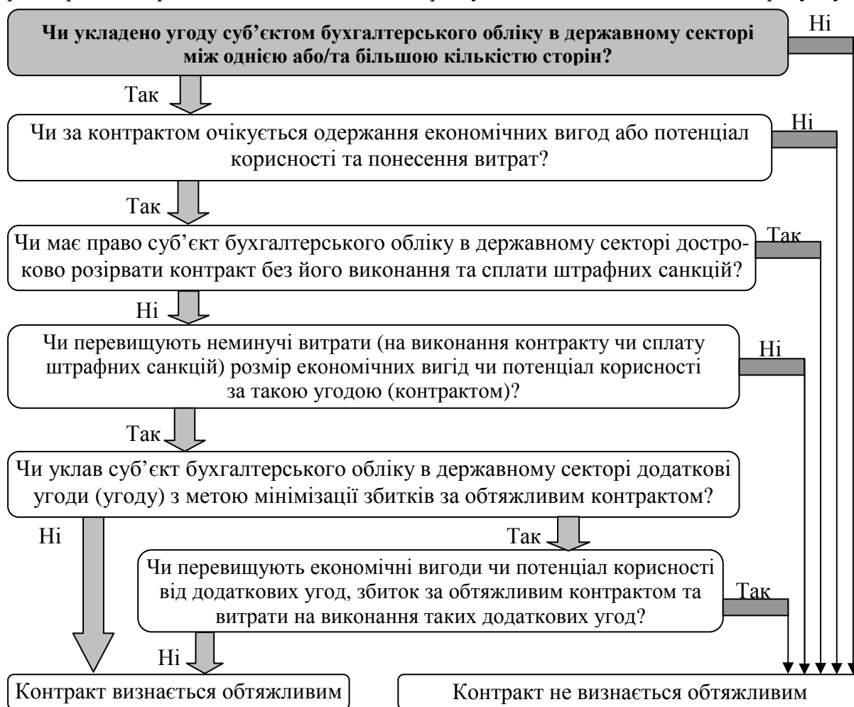
Рис.1. Дерево прийняття рішення щодо визнання контракту обтяжливим у суб'єктів бухгалтерського обліку в державному секторі

На підставі уточнення дефініції поняття «обтяжливий контракт» нами розроблено дерево прийняття рішення щодо визнання контракту обтяжливим, яке наведено на рисунку 1.