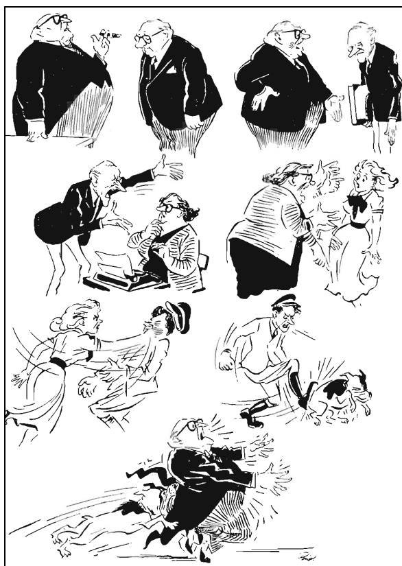
Рис. 3. Замкнуте коло

Зокрема, екологічна модель здатна слугувати одночасно двом цілям: кожен її рівень є певним рівнем ризику, чинником насильницької поведінки, але разом із цим усі рівні можна розглядати як мішені, ключові моменти реагування на насильство. Експерти ВООЗ виділяють такі завдання боротьби з насильством на різних рівнях [5]: