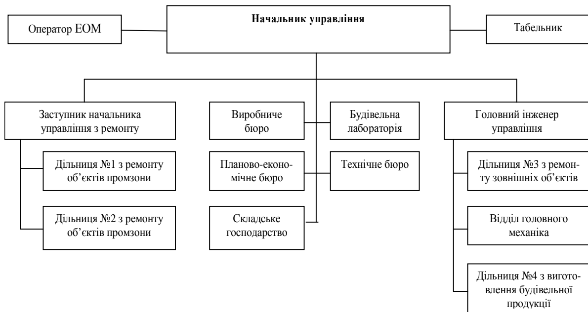
Рис. 1. Організаційна структура РБУ ЕРП

Велику роль ВП ХАЕС приділяє питанням поточних (капітальних) ремонтів виробничих споруд, будівель і антикорозійного покриття трубопроводів. Для цього виділено окремі підрозділи: відділ планування і проведення ремонтів, конструкторсько-технологічний відділ, енергоремонтний підрозділ. Ремонтно-будівельне управління (РБУ) входить до складу енергоремонтного підрозділу (ЕРП), який являється основним підрозділом ВП ХАЕС, та веде самостійно виробничо-господарську діяльність. Структура РБУ ЕРП та підпорядкованість показана на рис. 1.