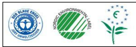
Рисунок 3.1 – Знаки екологічного маркування

Найменування розміщують під зображенням після номера рисунка, наприклад: