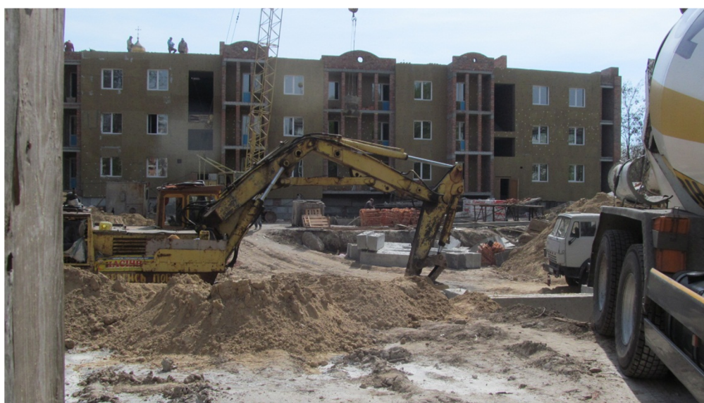
Рис. 3. Будівництво житлового будинку на вул. Князя Чорного 4