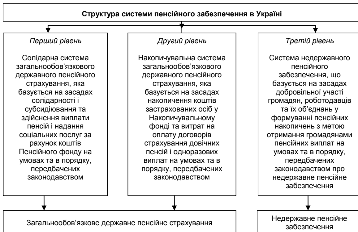
Рис. 1. Структура системи пенсійного забезпечення в Україні

Пенсійна система України – сукупність створених в Україні правових, економічних і організаційних інститутів і норм, метою яких є надання громадянам матеріального забезпечення у вигляді пенсії. Пенсійна система України в сучасному вигляді започаткована в січні 2004 року і містить у собі відносини по формуванню, призначенню і виплаті пенсій в трирівневій пенсійній системі [1, с. 5].