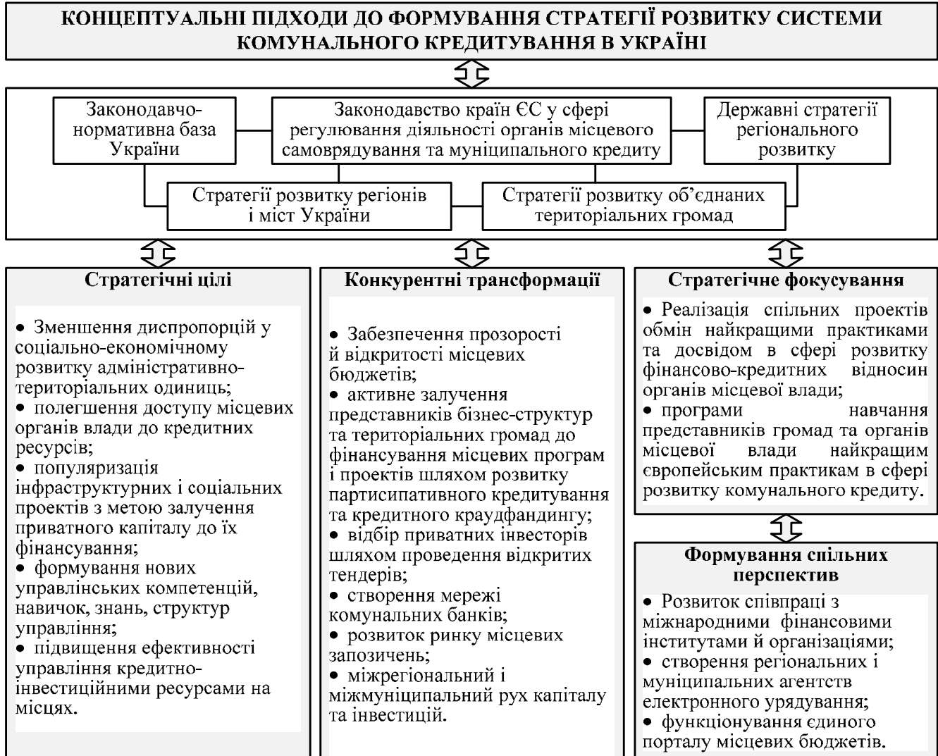
Рис. 3. Стратегія розвитку системи комунального кредитування в Україні

валютного та процентного ризиків, досягнення високого рівня прозорості кредитних угод, незалежності від банку; для кредиторів – самостійність у прийнятті рішень щодо вибору проектів і позичальників; валюти позики, терміну кредитування; для банківських установ – перекладання ризику ліквідності на кредиторів (інвесторів), сприяння фінансування найбільш якісних та соціально значущих проектів та венчурного фінансування, диверсифікації ризиків.