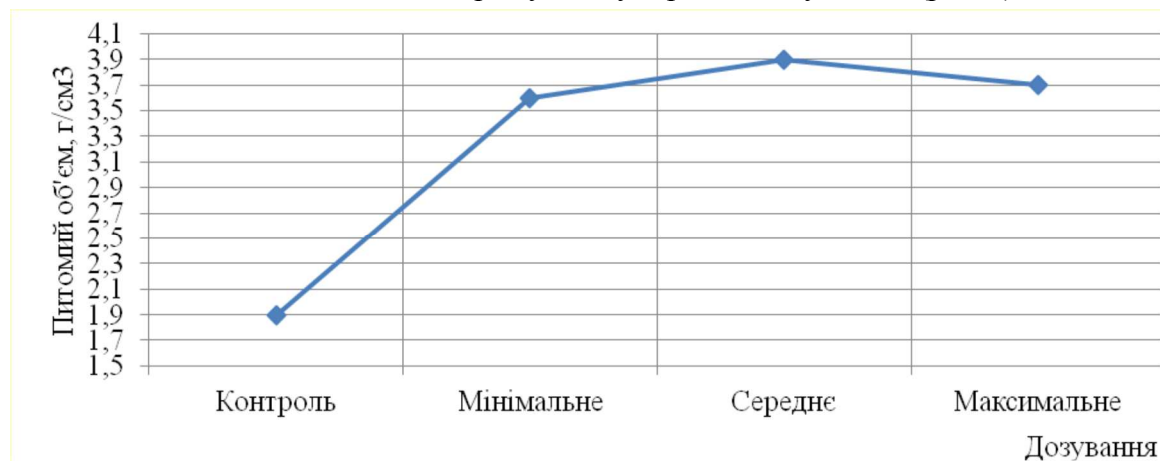
Рис. 4. Питомий об'єм хліба при різних дозуваннях комплексу з Alphamalt A 6003 і Porit-L

Аналіз якості хліба показав, що вже при мінімальному дозуванні спостерігаються значне збільшення питомого об'єму хліба з 1,9 до 3,6 см 3 /г. При середньому дозуванні питомий об'єм збільшився до 3,9 см 3 /г, максимальне дозування призводить до зменшення питомого об'єму і збільшення пористості з нерівномірно розподіленими порами. Найкращі результати якості хліба показав комплекс покращувачів у середніх дозуваннях (рис. 4).