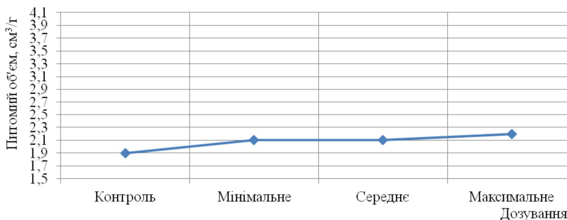
Рис. 2. Питомий об'єм хліба при різних дозуваннях ферментного препарату Porit-L

Porit-L вводився в борошно в таких дозуваннях: мінімальне – 0,05 г/кг; середнє – 0,1 г/кг; максимальне – 0,2 г/кг. Амінокислота цистеїн не чинила суттєвого впливу на якість хліба, при максимальному дозуванні питомий об'єм хліба показав найкращий результат і збільшився з 1,9 до 2,2 см 3 /г (рис. 2), але такі зміни не набагато кращі за мінімальне і середнє дозування, що мають однакові результати: так, при мінімальному і середньому дозуваннях питомий об'єм збільшився в 1,1 раза, а при максимальному в 1,2. Такі зміни якості пов'язані з невисоким вмістом клейковини (білка) і низькою газоутримуючою здатністю досліджуваного зразка борошна, яка при розслабленні клейковини зменшується.