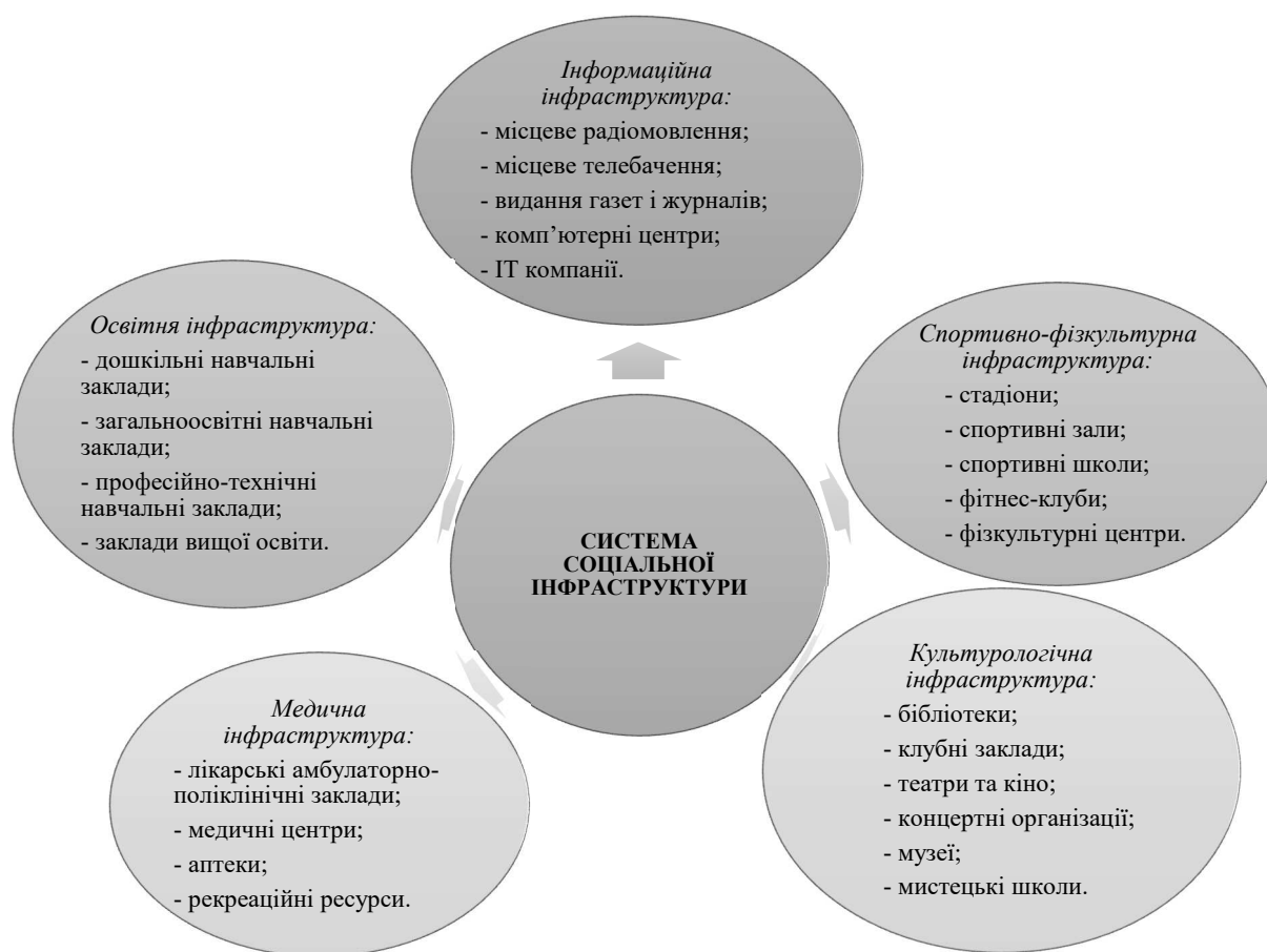
Рис. 1. Компоненти системи соціальної інфраструктури соціогуманітарного простору регіону