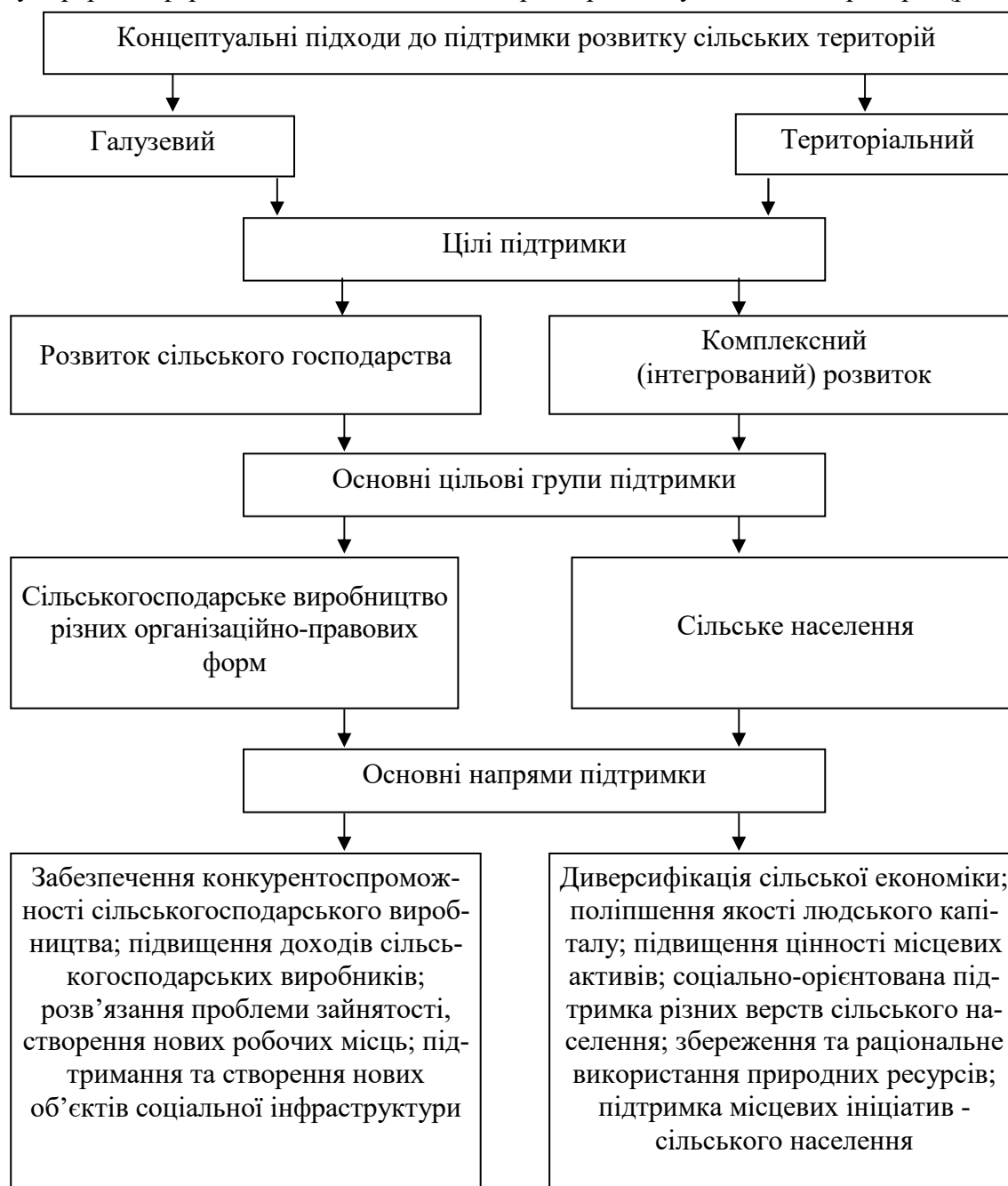
Рис. 2. Напрями розвитку сільських територій

Узагальнення напрацювань українських і закордонних учених, практичних результатів у аграрній сфері дозволило визначити напрями розвитку сільських територій (рис. 2).