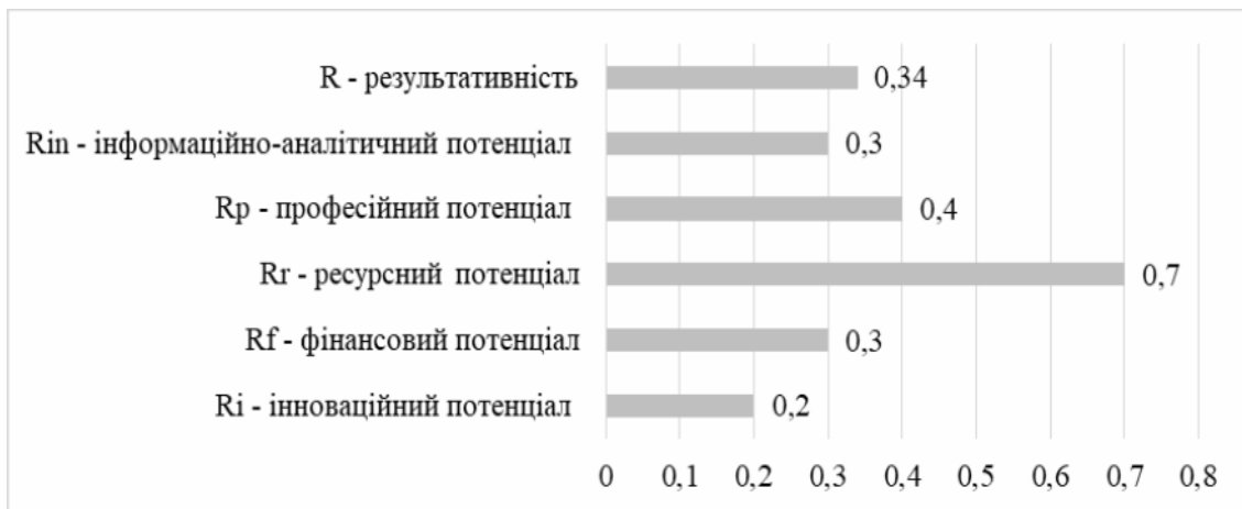
Рис. 2. Результати моделювання результативності державного регулювання інноваційного розвитку сфери охорони здоров'я в Україні

Результати науково-практичної апробації запропонованої моделі представлені на рис. 2. Для досягнення позитивного ефекту зміни повинні відбуватися комплексно та стосуватись одразу сукупності параметрів сфери охорони здоров'я. Тобто при підвищенні фінансового та інноваційного потенціалів на 0,4 Україна зможе значно покращити стан сфери охорони здоров'я.