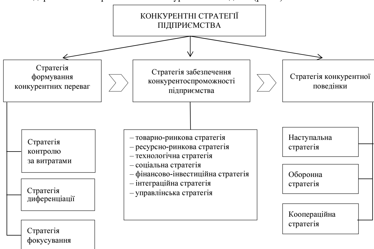
Рис. 2. Система конкурентних стратегій підприємства

Система конкурентних стратегій підприємства – це сукупність стратегій, спрямованих на адаптацію підприємства до змін в умовах конкуренції та на зміцнення його довгострокової конкурентної позиції на ринку [2]. Система конкурентних стратегій включає: стратегію надбання конкурентних переваг, стратегію забезпечення конкурентоспроможності підприємства та стратегію його конкурентної поведінки (рис. 2).