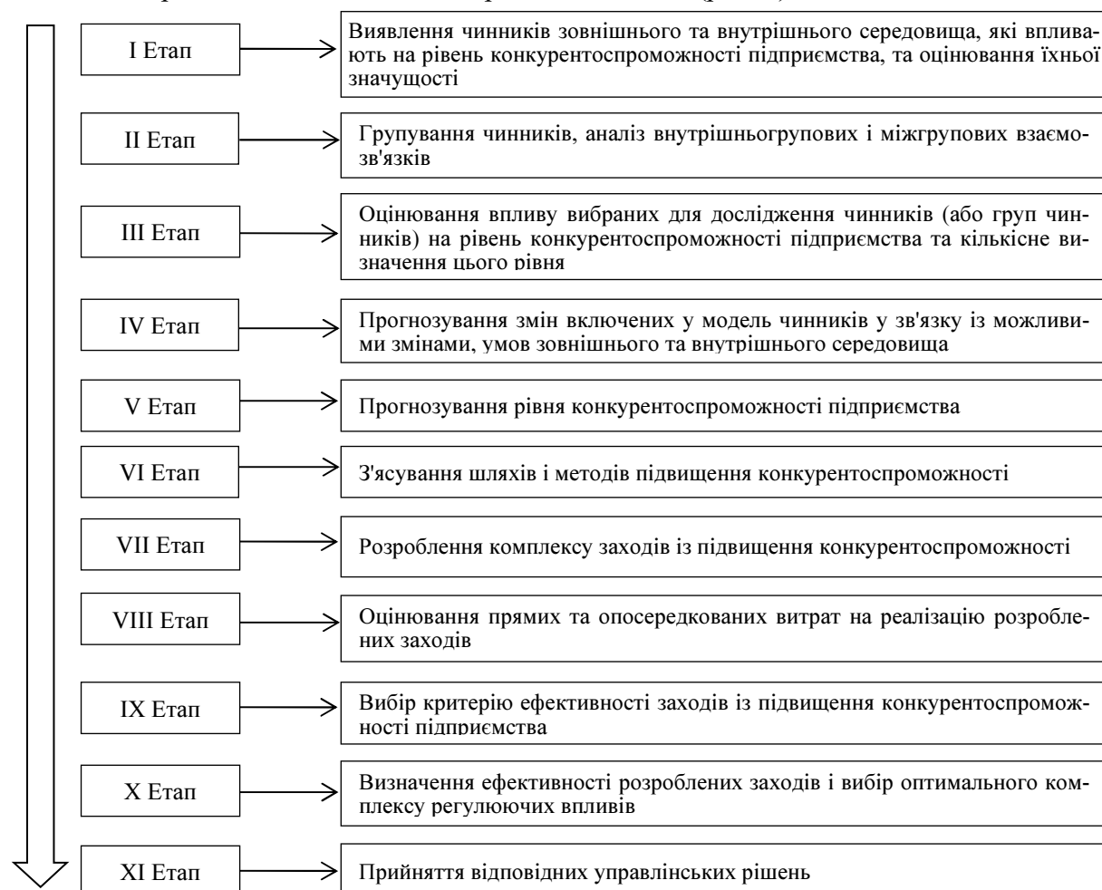
Рис. 1. Послідовні етапи управління конкурентоспроможністю підприємства Джерело: сформовано автором на основі джерела [6, с. 63–66] та власних напрацювань.

Загальний порядок дослідження, оцінки та загалом управління конкурентоспроможністю підприємства охоплює певні принципові етапи (рис. 1).