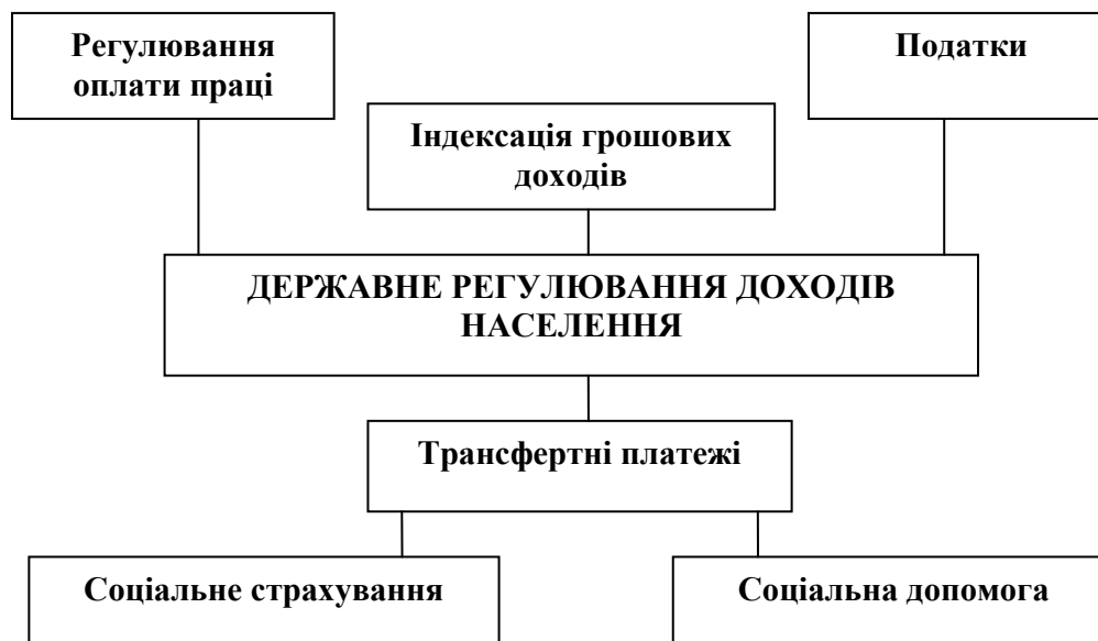
Рис. 1. Інструменти державного регулювання доходів населення

Регулюючи розподіл національного доходу між різними факторами виробництва, державні інституції найчастіше використовують інструменти, що впливають на рівень оплати праці, а також оподаткування (рис. 1).