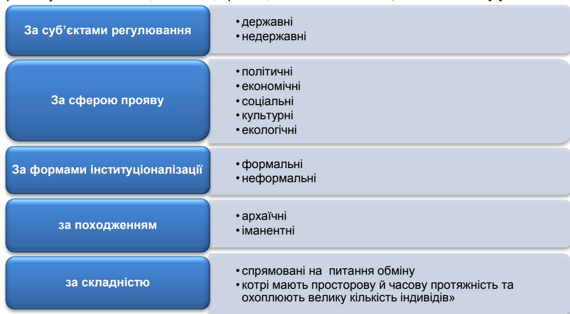
Рис. 4. Класифікація інституціонального середовища

Тобто, синонімічний ряд до поняття “інституція” обмежується лише визначенням “механізму”, але ні в якому разі не “інституту”. Інституції створюють інституційне середовище, яке впливає на поведінку індивіда, але при цьому встановлює обмеження для здійснення його діяльності, використовуючи економічні, політичні, правові, психологічні та соціальні чинники [1].