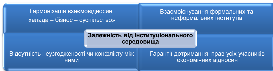
Рис. 5 Залежності від інституційного середовища

- гарантії дотримання прав усіх учасників економічних відносин у ході здійснення операцій та по завершенню трансакцій.