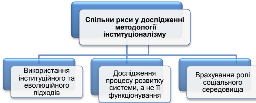
Рис. 2. Спільні риси у дослідженні методології інституціоналізму

Спільні риси у дослідженні методології інституціоналізму представлені на (Рис. 2).