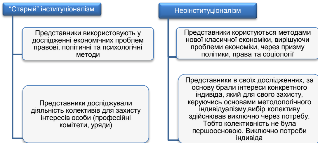
Рис. 3. Особливості шкіл інституціоналізму

Порівнюючи основні підвалини постулатів "старого" інституціоналізму та неоінституціоналізму, можна виокремити суттєві особливості кожної з шкіл (Рис. 3).