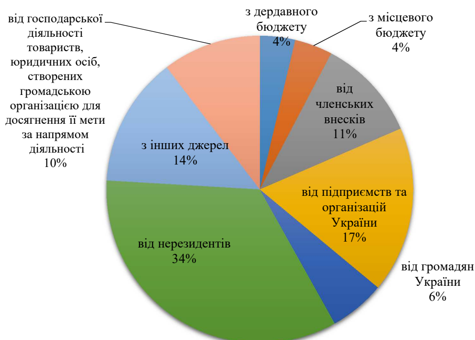
Рис. 2. Структура фінансування інститутів громадянського суспільства у 2018-2019 рр.