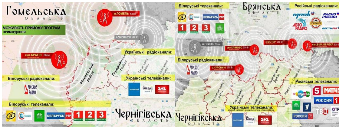
Рис. 2. Потенційні можливості прийому телесигналу іноземних теле- та радіопрограм

В умовах інформаційного перенавантаження масова свідомість часто не може розрізнити реальне від віртуального, факти від припущень та вимислів.