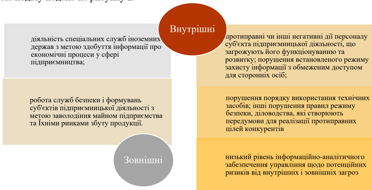
Рисунок 2 - Характеристика економічних загроз безпеки підприємств

Економічні загрози безпеки підприємств можна поділити на внутрішні та зовнішні. Схеми поділу подана на рисунку 2.