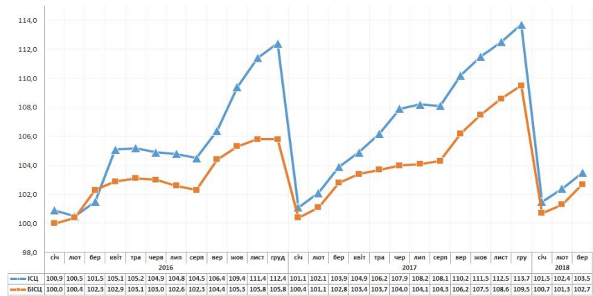
Рис.1 – Динаміка індексу споживчих цін та базового індексу споживчих цін за 2016 – 2018 роки (%) [3]

Протягом останніх років рівень інфляції в Україні зменшується, однак, цей показник є одним з найвищих серед усіх розвинутих країн світу. Середній показник інфляції в більшості країн Європи становить 2,6%, в країнах СНД – 6,7% [5].