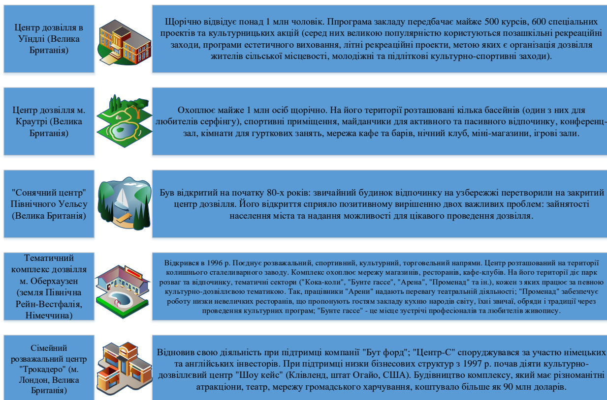
Рисунок 2 – Зарубіжний досвід створення культурно-дозвіллевих закладів

Широка перспектива загальної політики керівництва більшості традиційних установ дозвілля є запорукою успішної адаптації стратегічних завдань культурно-дозвіллевих закладів до умов сучасності. Основні практики зарубіжного досвіду наведено на рисунку 2.