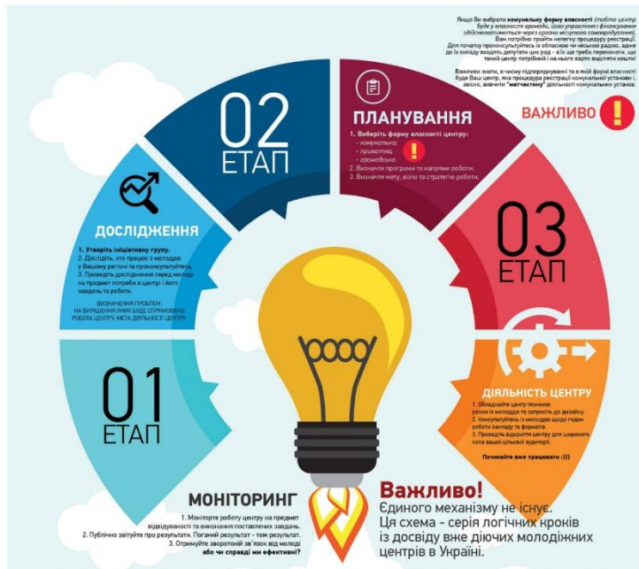
Рисунок 3 – Покрокова інструкція створення молодіжного центру