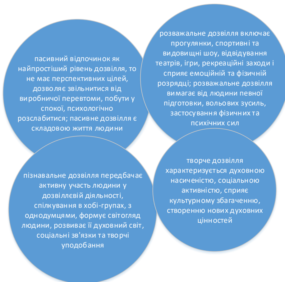
Рисунок 1 – Форми та види відпочинку

Починаючи з II половини XX століття, сформувалися концепції, що розглядають дозвілля як складову часового простору, як вид людської життєдіяльності, як психологічний стан людини, як ознаку цілісного способу життя. На рисунку 1 наведено узагальнену систему форми та видів відпочинку.