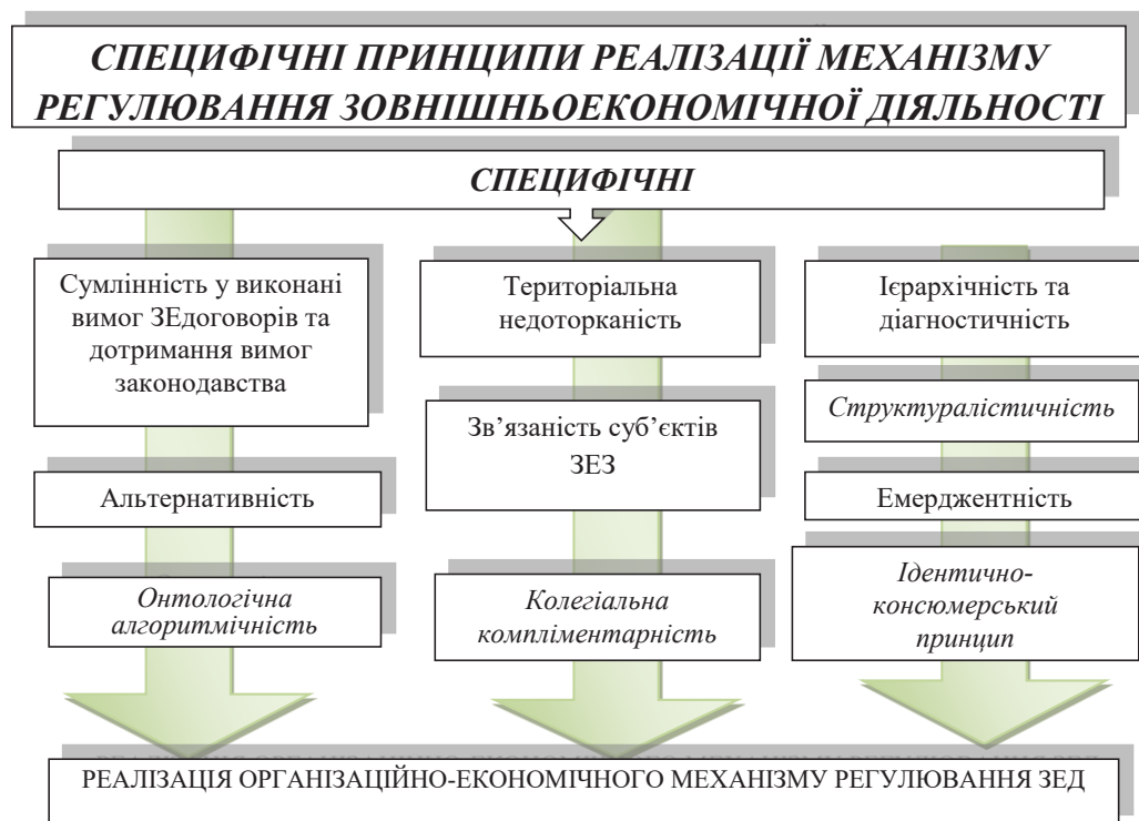
Рис. 3. Системність специфічних принципів реалізації організаційно-економічного механізму реалізації ЗЕД

Висновки. Отже, очевидним є те, що саме за рахунок впровадження системи принципів реалізації організаційно-економічного механізму розвитку ЗЕД промислового виробництва, як гнучкої, адаптованої до змін зовнішнього середовища відповідними змінами внутрішнього середовища сукупності взаємозв'язаних цілей, ресурсів, кон'юнктури ринку, компонент організаційного та економічного змісту, принципів управління та методів проектування, можливим є розробка та реалізація програми розвитку ЗЕД промислового виробництва задля досягнення цілей стратегічного розвитку держави.