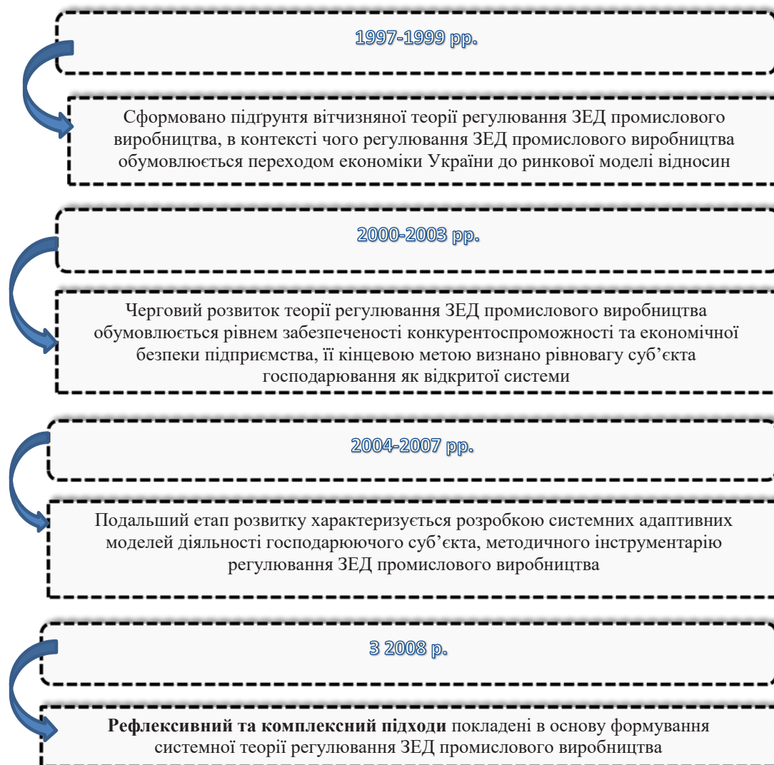
Рис. 2. Генезис теорії регулювання ЗЕД промислового виробництва у теорії економічної думки