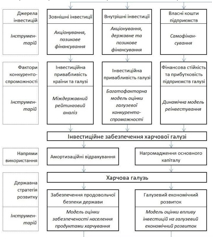
Рис. 2. Концепція інвестиційного забезпечення харчової промисловості України

З урахуванням вищесказаного, відповідна концепція інвестиційного забезпечення харчової промисловості України, наведена на рис. 2.