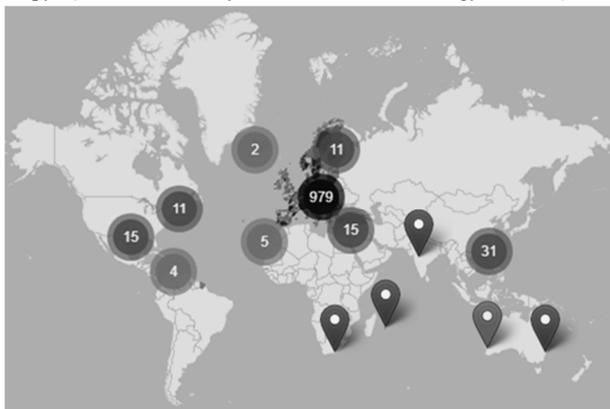
Рис. 1. Картографічне зображення зареєстрованих кластерів станом на 2019 р.

Pharmapolis Debrecen Innovative Pharmaceutical Cluster (Угорщина), Smart IT Cluster Lithuania, Innovative and Industrial Cluster in the field of Biotechnologies and «green economy» (Білорусь), Green Economy Cluster, Wind Technology Cluster (Естонія) та інші.