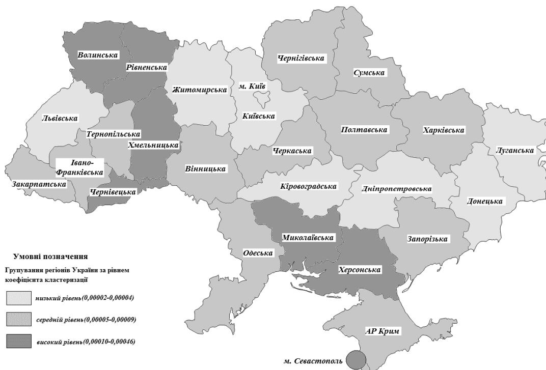
Рис. 3. Групування регіонів України за рівнем коефіцієнта кластеризації