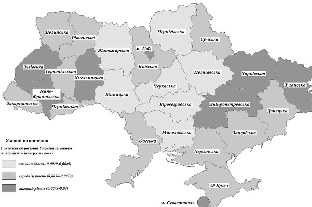
Рис. 4. Групування регіонів України за рівнем коефіцієнта інтегративності