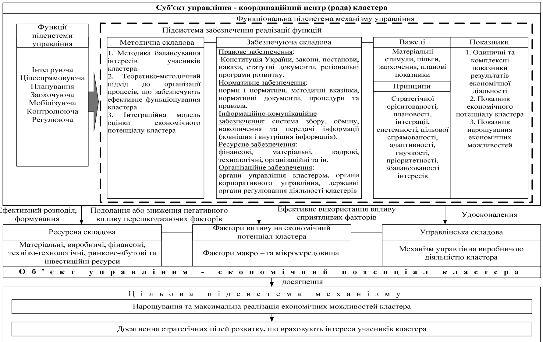
Рис. 2. Організаційно-економічний механізм управління економічним потенціалом кластера