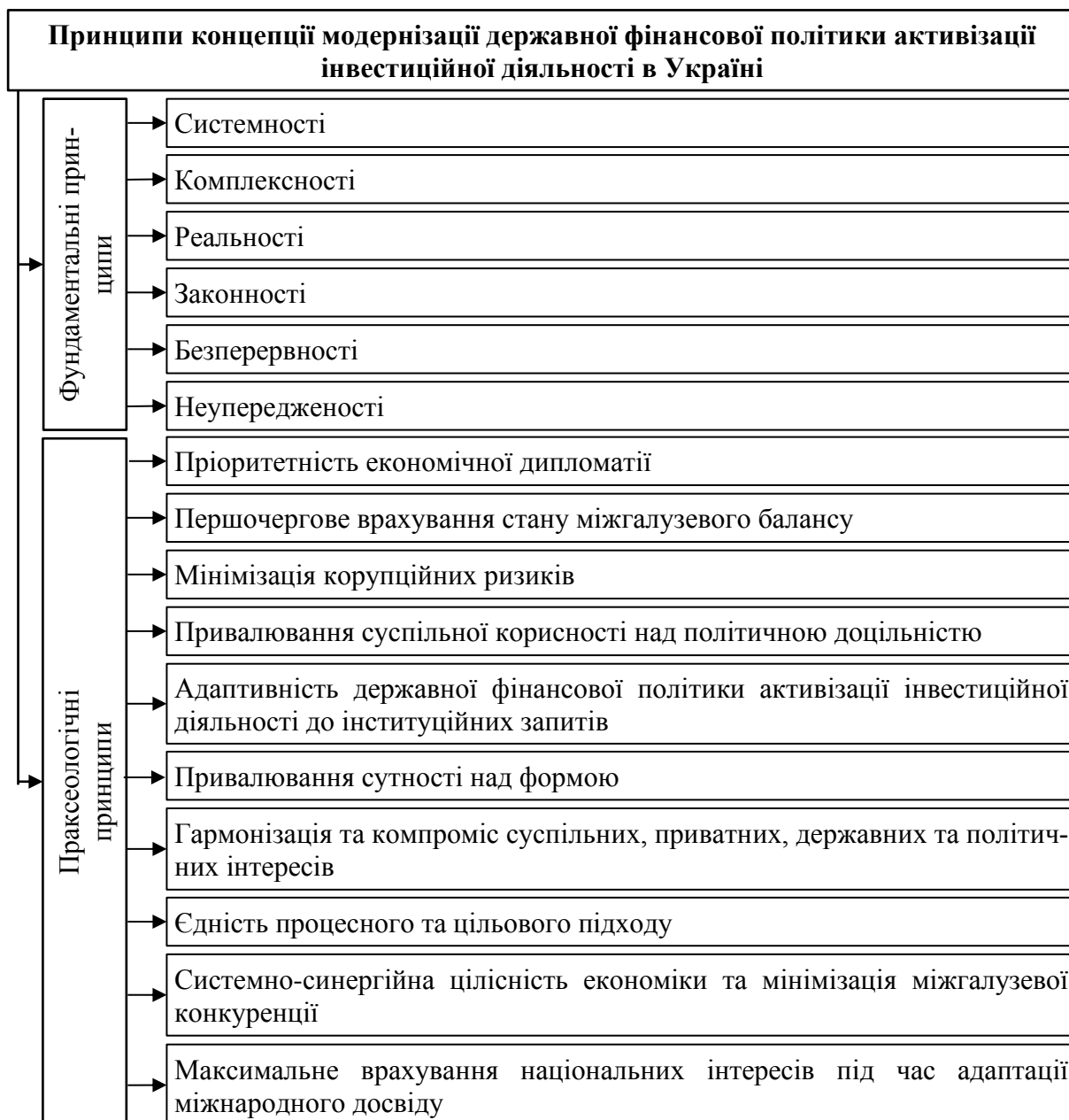
Рис. 4. Принципи концепції модернізації державної фінансової політики активізації інвестиційної діяльності в Україні