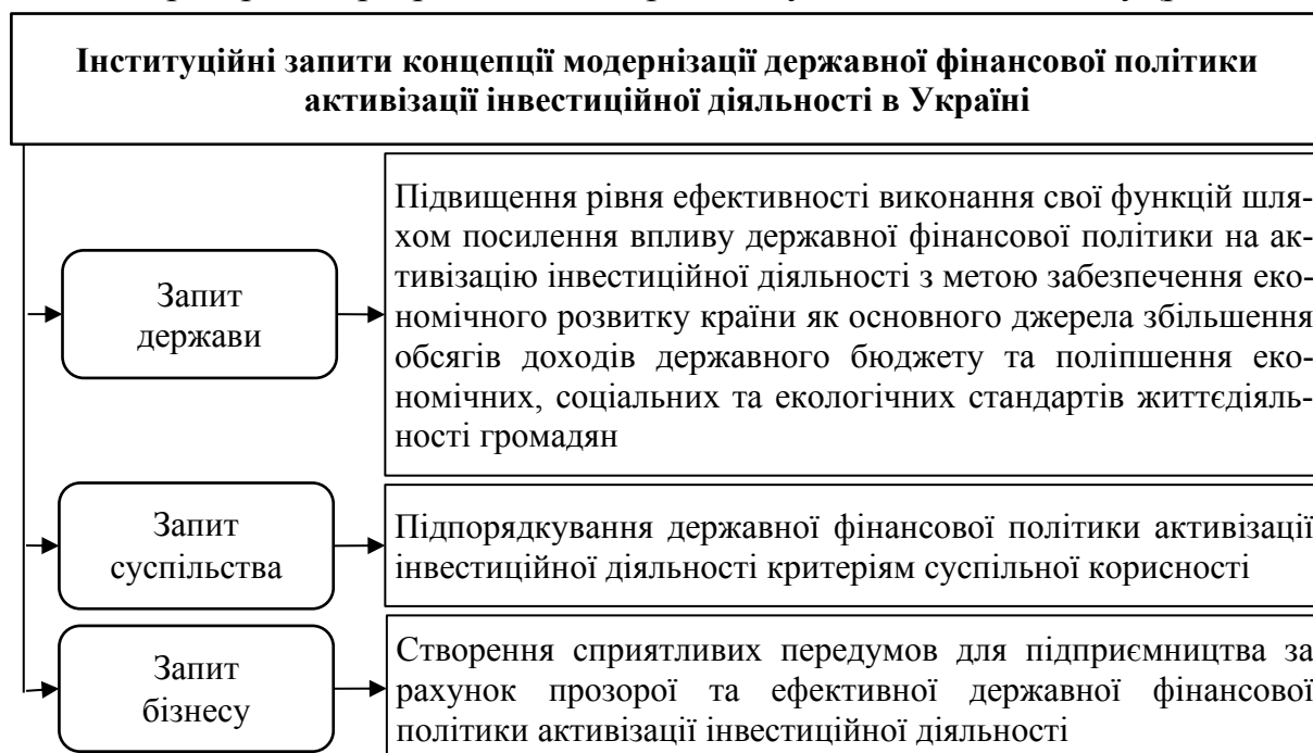
Рис. 2. Інституційні запити концепції модернізації державної фінансової політики активізації інвестиційної діяльності в Україні

У свою чергу, інституційні запити концепції модернізації державної фінансової політики активізації інвестиційної діяльності в Україні вбачається за доцільне розкрити в розрізі запитів держави, суспільства та бізнесу (рис. 2).