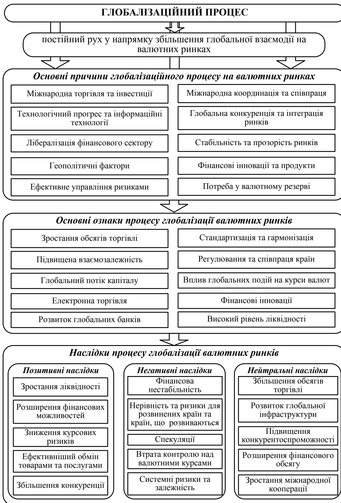
Рис. 3. Основні причини, ознаки й наслідки процесу глобалізації валютних ринків