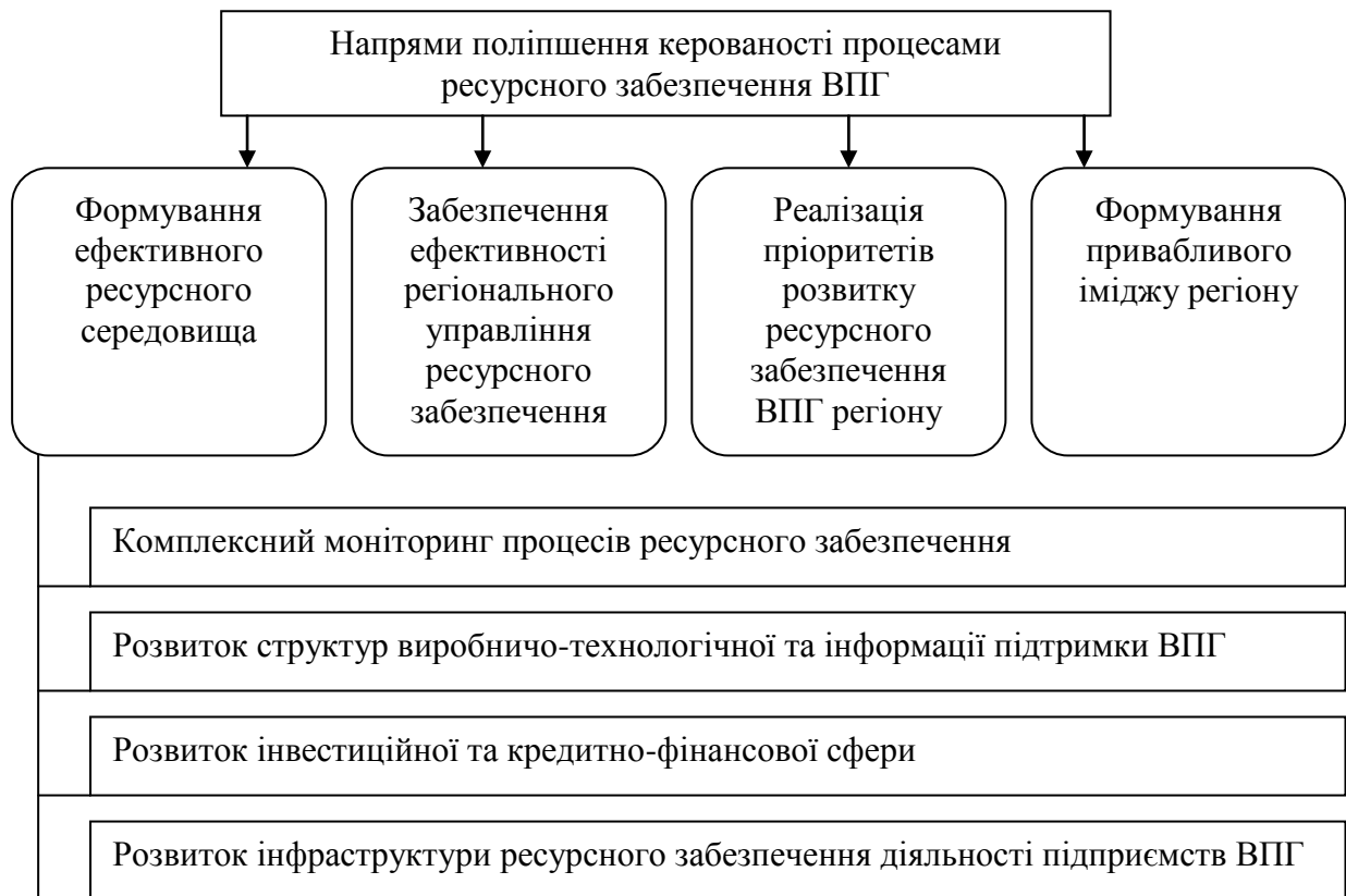
Рис. 3. Напрями поліпшення керованості процесами ресурсного забезпечення ВПГ

Реалізацію напрямів доцільно розпочати з аналізу процесів ресурсного забезпечення ВПГ регіону, оскільки в сучасних умовах на регіональному рівні необхідно формувати систему ресурсного забезпечення з подальшим її розвитком, яка б була об'єднуючою ланкою між інформаційною та ресурсною інфраструктурами регіону.