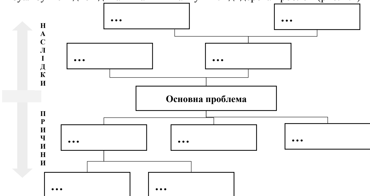
Рис. 1.2. Дерево проблем

2) Класифікуйте ідентифіковані загрози та визначте джерела цих загроз. Візуалізуйте відповіді на питання 1 та 2 у вигляді дерева проблем (рис. 1.2)