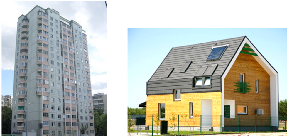
Рис. 4. Українські проекти

Аналіз існуючих українських будівельних норм показав, що в них: – відсутні поняття геометричних теплових мостів та їх розрахунку; – відсутня методика розрахунку теплових мостів для конструкцій, що контактують з ґрунтом у неопалюваних приміщеннях; – розрахунок теплових мостів виконують за внутрішніми розмірами.