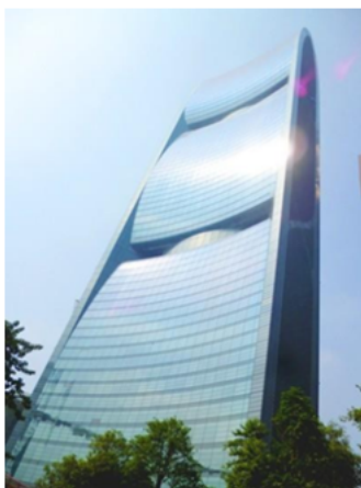
Рис. 2. Pearl River Tower – лідер з енергоефективності (2010 рік, Китай)

Найбільш енергоефективною висотною будівлею велика кількість спеціалістів називають 309-метрову башту Pearl River Tower, побудовану в Гуанчжоу (рис. 2). Будівля має 71 поверх. Спроекували її американці – інженери із Skidmore, Owings & Merrill. Прикладами енергоефективних будівель також є Commerzbank (1997 р., Німеччина), MAIN TOWER – у Франкфурті-на-Майні (2000 р., Німеччина), London City Hall (2002 р., Велика Британія) (рис. 3).