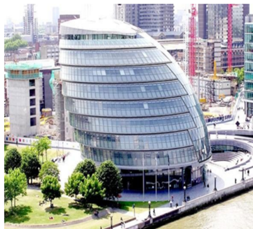
Рис. 3. London City Hall (2002 рік, Велика Британія)

Метою вітчизняного проекту енергоефективної будівлі було створення, передексплуатаційна перевірка і наступне впровадження в житлове будівництво міст новітніх технологій і обладнання, що забезпечують як мінімум двократне зниження енергозатрат на експлуатацію житлового фонду. У 2015 р. у Київській області офіційно було введено в експлуатацію перший серійний енергоефективний будинок в Україні – OptimaHouse, який було створено на основі європейських концепцій «Мультикомфортний дім» та «Активний дім», спеціально адаптованих для українського ринку. Низький рівень енергоспоживання, короткі терміни будівництва, незалежність від газопостачання, доступна ціна – головні переваги новобудови (рис. 4).