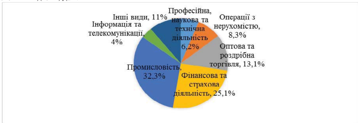
Рис. 1. Структура ПІІ в Україні за видами економічної діяльності станом на 01.01.2015 р.

Аналіз галузевої привабливості України свідчить, що найбільш інтенсивно інвестиційні процеси спостерігаються у високорентабельних сферах, які не потребують значного вкладення капіталу при забезпеченні швидкої віддачі.