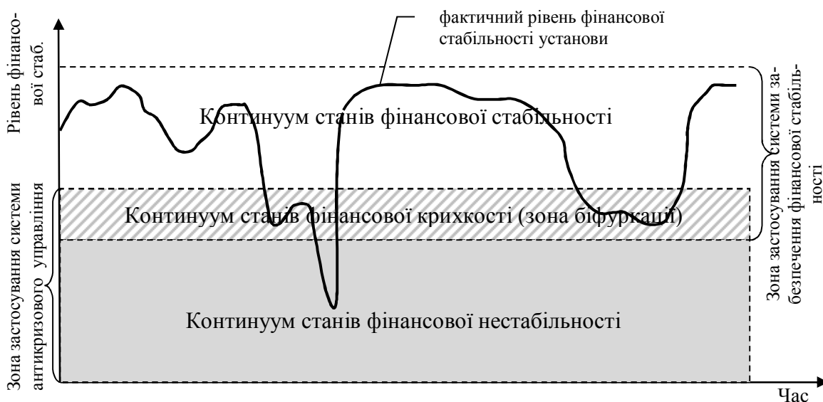
Рис. 1. Розподіл функціональних зон застосування системи антикризового управління та системи забезпечення фінансової стабільності кредитної установи

Вважаємо, що антикризове управління установою за своїм функціональним змістом є синонімічним процесу попередження фінансової нестабільності установи. У свою чергу, забезпечення фінансової стабільності передбачає використання таких управлінських і фінансових механізмів, які б уможливили підтримку у часі цільового рівня фінансової стабільності кредитної установи та недопущення її критичного зниження. Однією з базових ознак антикризового управління є його стратегічна спрямованість, що є характерним і для забезпечення фінансової стабільності кредитної установи. Проте об'єктом уваги установи в аспекті її антикризового управління є кризотвірні фактори, у той час як у процесі забезпечення фінансової стабільності здійснюється комплексний моніторинг всієї сукупності внутрішніх та зовнішніх чинників, які впливають на рівень фінансової стабільності, у тому числі тих, які здатні викликати фінансову нестабільність, тобто кризовий стан кредитної організації. Розрізняючи стабільний, крихкий та нестабільний види фінансового стану кредитної установи вважаємо, що заходи із антикризового управління спрямовані на подолання негативного стану установи (крихкого або нестабільного) та повернення до попереднього ефективного функціонування та розвитку, тобто до континууму станів фінансової стабільності (рис. 1).