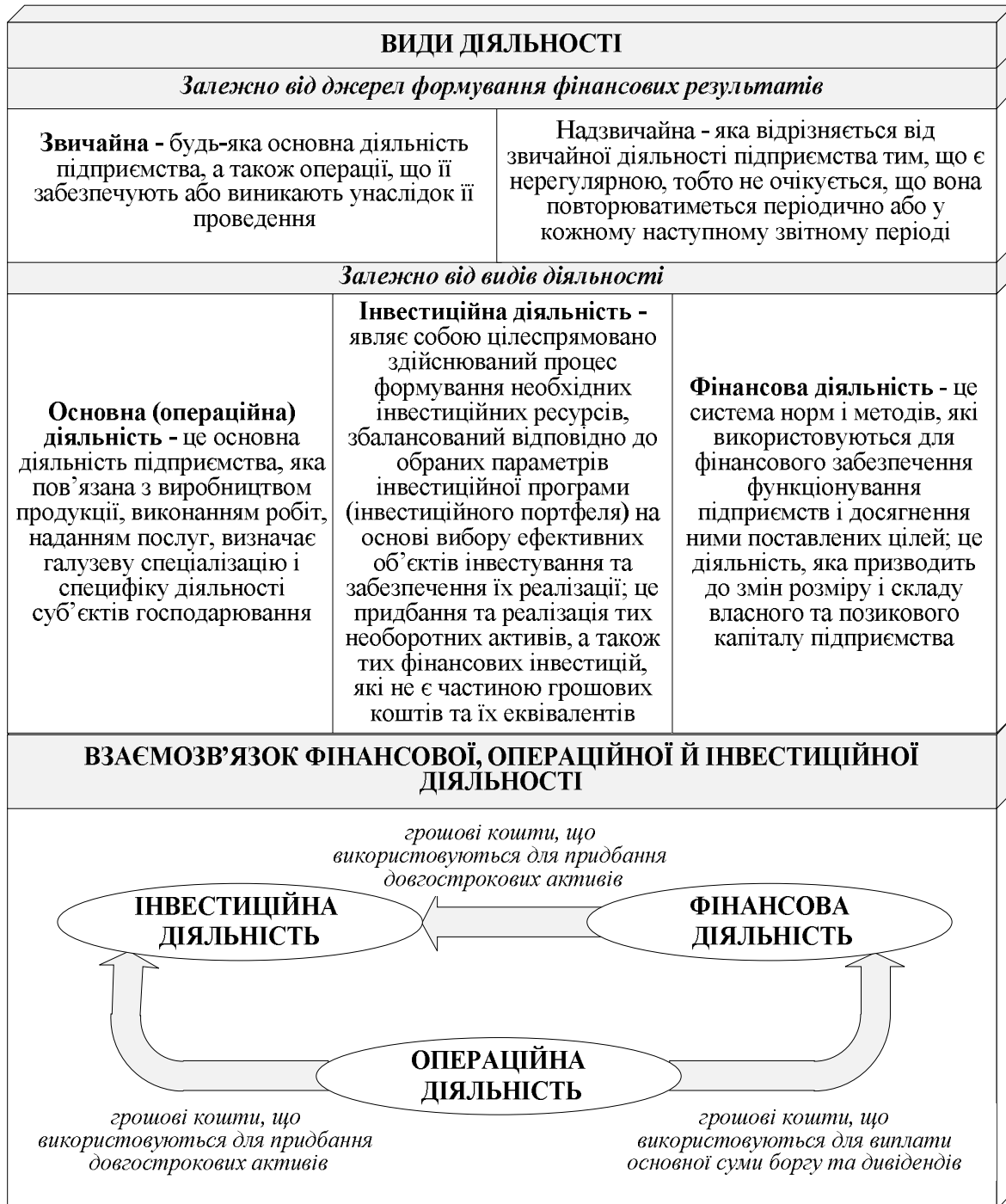
Рис. 3. Класифікація видів діяльності суб'єктів підприємництва, їх взаємозв'язок та взаємодія

На рівні суб'єкта підприємництва згідно з П(С)БО виділяють такі види діяльності (рис. 3): операційна, фінансова, інвестиційна.