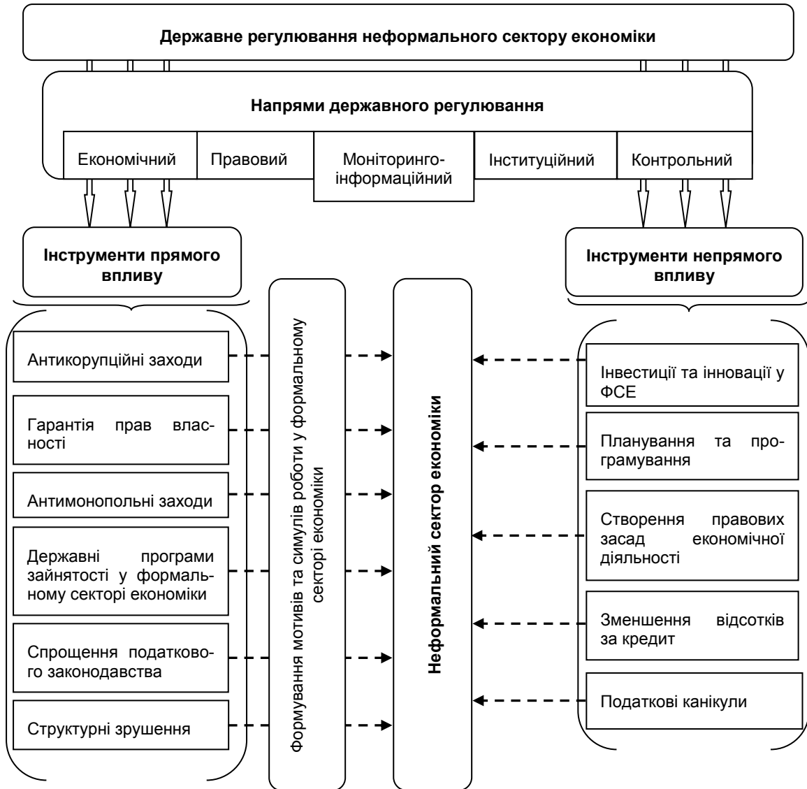
Рис. 2. Система державного регулювання неформального сектору економіки

кової системи; захист конкуренції, розподілу та перерозподілу ресурсів, прибутку й багатства; контролю за рівнем зайнятості й інфляції; стимулювання економічного зростання [16].