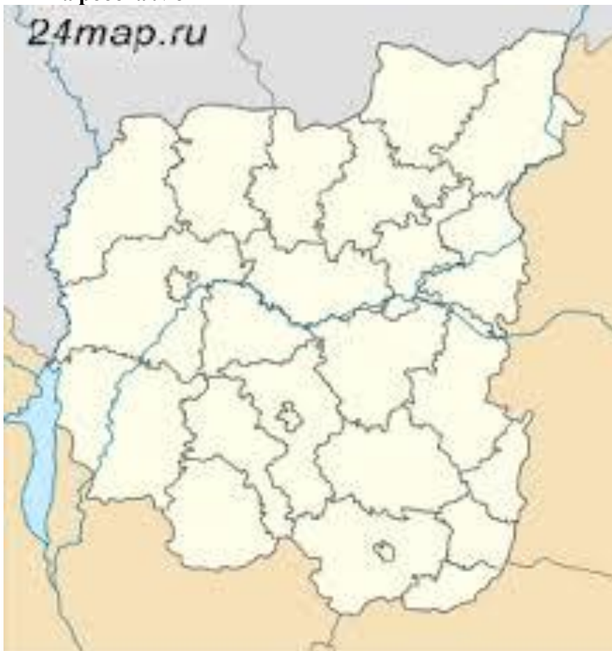
Рис.1 Чернігівська область