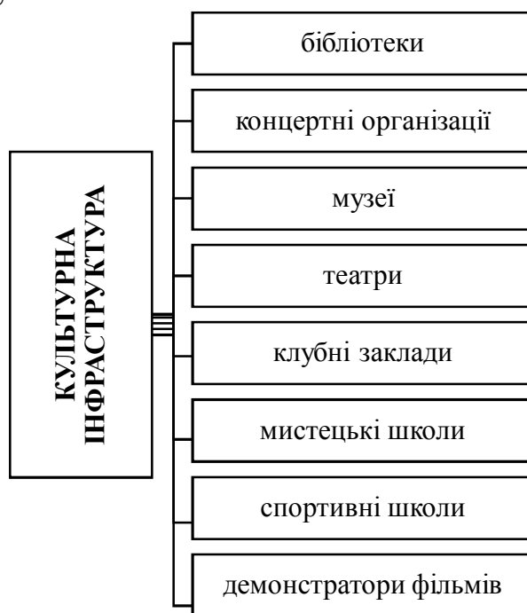
Рис. 1. Складові культурної інфраструктури соціогуманітарного простору

До основних складових культурної інфраструктури, які впливають на формування соціогуманітарного простору та розвиток соціальної інфраструктури загалом, слід віднести: бібліотеки, клубні заклади, театри, концертні організації, музеї, мистецькі та спортивні школи, демонстратори фільмів (рис. 1). Взаємодія окремих компонентів культурної інфраструктури залежить переважно від їхнього характеру, простору обслуговування та рівня доступності.