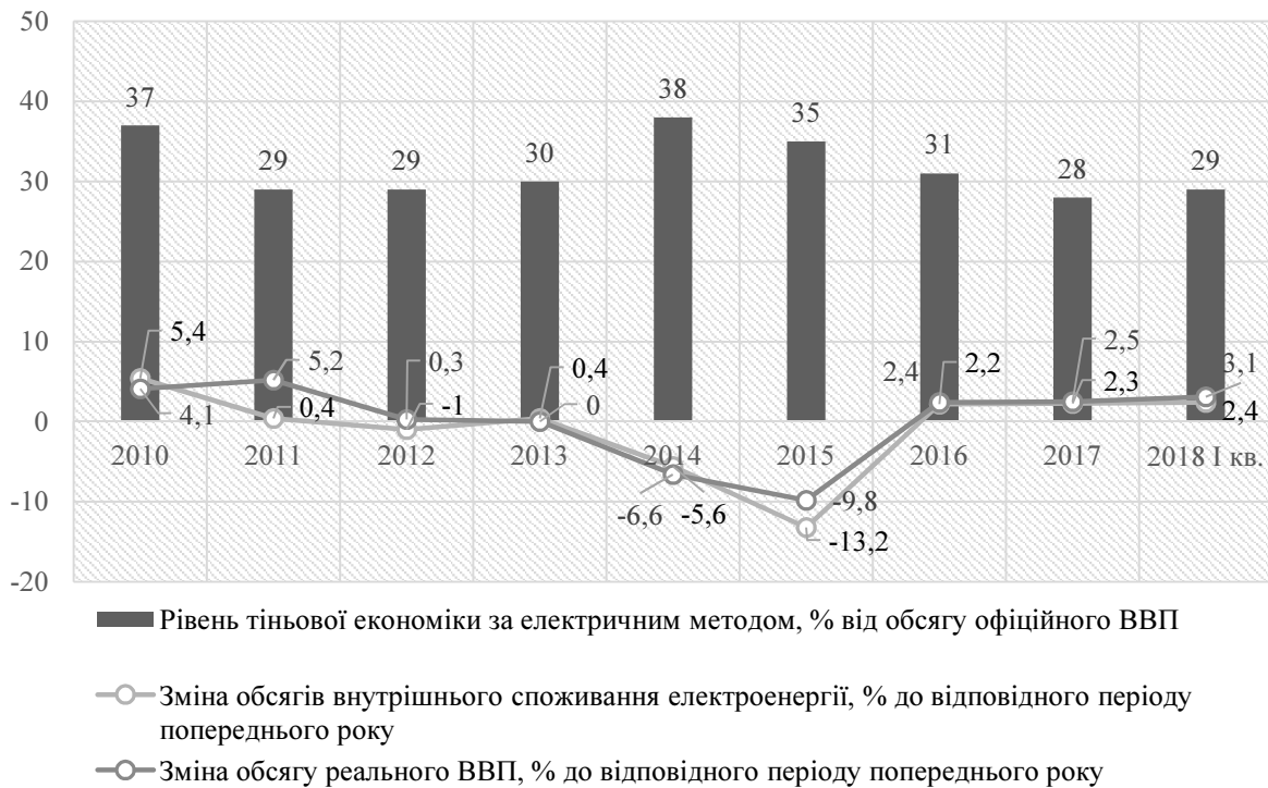
Рис. 2. Рівень тіньової економіки за електричним методом, у % до офіційного ВВП

Розраховане значення тіньової економіки за цим методом у I кварталі 2018 року становило 29 %, динаміка за декілька років наведена на рис. 2.