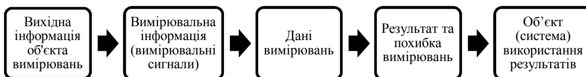
Рис. 1. Послідовність перетворення інформації про об'єкт дослідження

Вимірювальна технологія реалізує проведення процесу вимірювань на базі використання ІС та отримання результату і похибки вимірювань. На рис. 1 наведено послідовність перетворення інформації при проведенні моніторингу енергоефективності будівель та споруд.