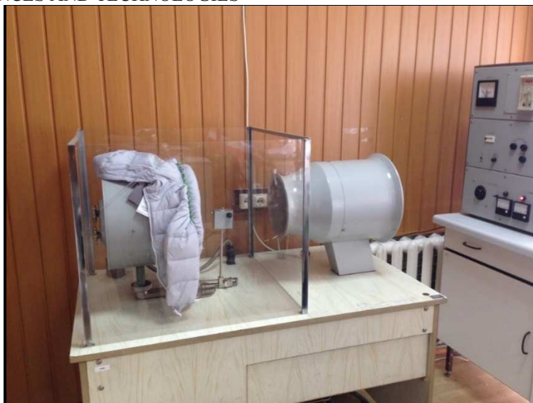
Рис. 2. Визначення показника сумарного теплового опору зразка 1 за допомогою приладу ПТС-225

Час охолодження пластини 1 зразка (пір'яно-пуховий наповнювач) склав 1367 с., а 2 зразка (синтетичний текстильний наповнювач) – 1433 с. Після проведення випробувань відбувалась обробка отриманих результатів, згідно з формулами 1-5: