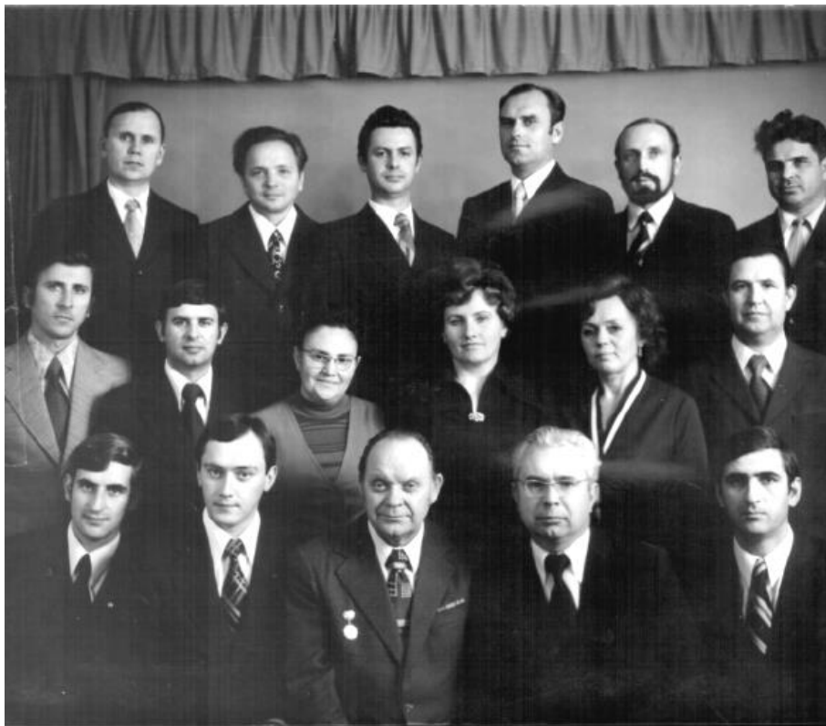
Кафедра технології машинобудування ЧФ КПІ. 1975 рік

За рік – незвільнений секретар парторганізації філіалу, а з 1974 р. керував кафедрою технології машинобудування.