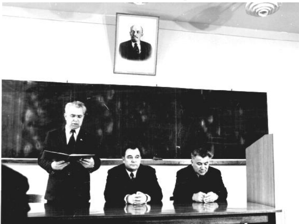
Проведення ленінського заліку. 1975 рік .