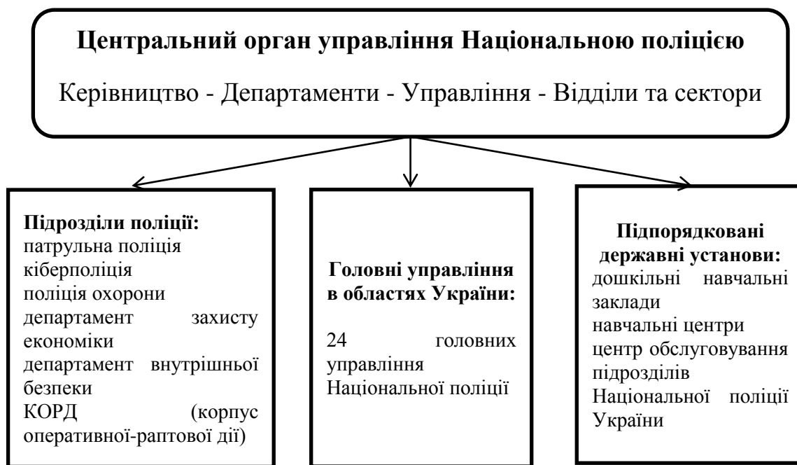
Рис. 2. Структура Національної поліції України

Схематична організаційна структура Національної поліції наведено на рисунку 2.