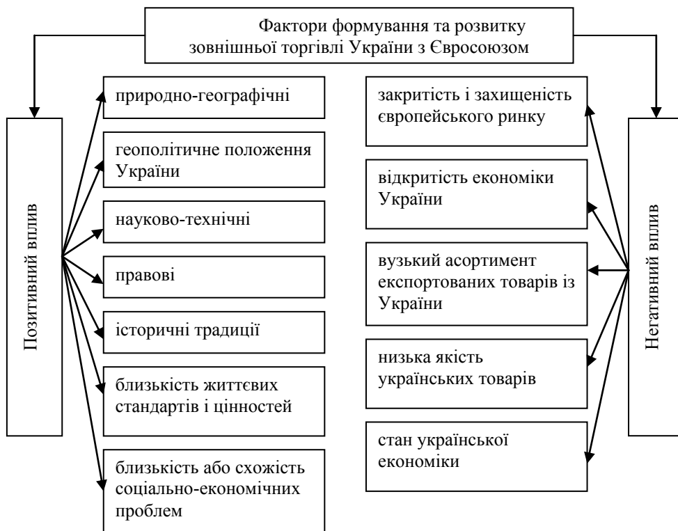
Рис. 1. Фактори формування та розвитку зовнішньої торгівлі України з Євросоюзом