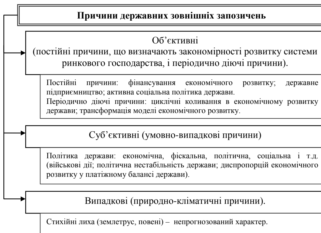
Рисунок 3.1 - Причини державних зовнішніх запозичень

Причини виникнення державних зовнішніх запозичень можна об'єднати у три групи, які представлені на рис. 3.1.