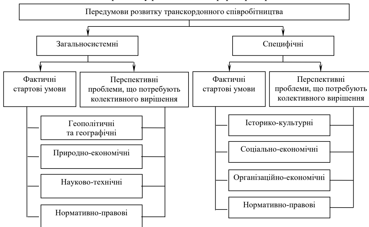
Рис. 1. Комплекс передумов розвитку транскордонного співробітництва

Отже, транскордонне співробітництво набуває все більш виражених форм, маючи як наслідок активний процес конвергенції економічного і соціального розвитку прикордонних регіонів, зокрема, що стосується інфраструктурного забезпечення. Передумовою цих процесів є геополітичні та географічні фактори, які пов'язані насамперед із зовнішньоекономічною політикою держав, спрямованою на ефективне співробітництво, особливостями географічного розташування регіонів, наявністю спільних кордонів і території проживання населення, що визначає схожість культури, мови, історії розвитку (рис. 1). Сукупність специфічних рис прикордонних територій – бар'єрності та контактності – забезпечує їх взаємну адаптацію в цьому процесі й дає підстави передбачати значний потенціал для розвитку різноманітних форм прикордонних відносин.