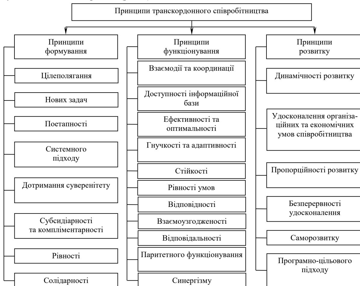
Рис. 3. Принципи транскордонного співробітництва

Сукупність принципів, на яких має будуватися ефективне транскордонне співробітництво, повинна охоплювати економічну, соціальну, інформаційну, науково-технічну, екологічну, культурну та інші сфери взаємодій прикордонних регіонів суміжних держав, а оскільки, як і будь-яка інша, система транскордонного співробітництва проходить три фази: формування, функціонування та розвитку, то всі принципи можна згрупувати за вказаними фазами (рис. 3).