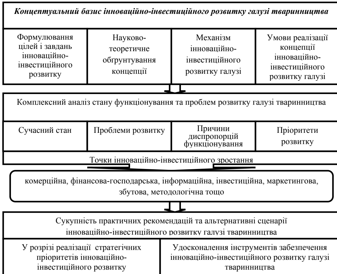
Рис. 2. Концептуальний базис інноваційно-інвестиційного розвитку галузі тваринництва

Доведено необхідність вдосконалення концептуального базису інноваційно-інвестиційного розвитку галузі тваринництва в частині обґрунтування траєкторії для переходу від ресурсної моделі функціонування галузі до інноваційно орієнтованої (рис. 2).