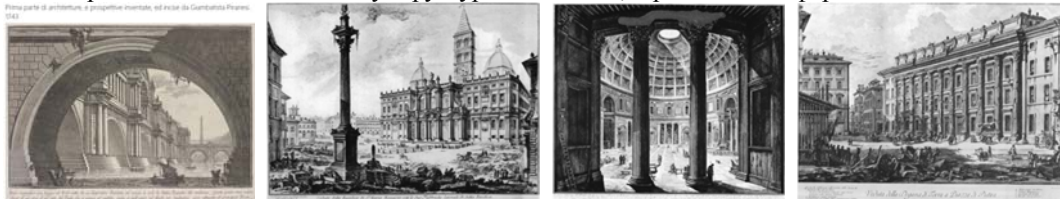
Рис.1 Види Риму

Створення на протязі всього життя гравюр «Види Риму» дозволило зберегти для нас образ Риму 18-го століття, де на місці величних будівель сучасні люди зайняті своїми скромними повсякденними справами, в роботах використано широкий діапазон пластичних і виразних засобів, відчуття деталей, оцінка просторових рішень і пропорцій будівель. Захоплення стародавньою цивілізацією Риму і розуміння неминучості її загибелі зображено з сильними ефектами світла і тіні, виділенням домінуючого архітектурного пам'ятника. Піранезі писав: «В архітектурі не слід зводити все до сухої функціональності. Все повинно бути відповідно до розуму і правди, але це загрожує все звести до колиб». Все повинно бути зведено до різноманітності та фантазії, інакше – архітектура перетвориться на ремесло. Сучасна дійсність і життя стародавніх пам'яток з'єднуються в листах в єдину поетичну розповідь про вічний рух історії, про зв'язок минулого і сьогодення. Замальовки античних пам'яток, деталей їх декору в техніці Сангіні, італійського олівця, поєднання малюнків італійським олівцем і пером, чорнилом, намагаються передати найважливіше: чітку структури пам'ятника, гармонію його форм.