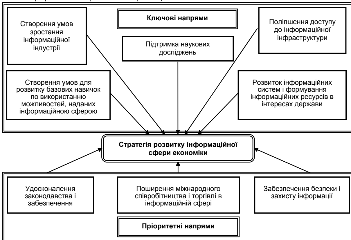
Рис. 2. Схема напрямів реалізації стратегії розвитку інформаційної сфери економіки

З метою сприяння належній реалізації визначених довгострокових цілей преставленої стратегії необхідно переглянути діючі пріоритети сучасної державної політики, розробити нові, адаптовані до актуальних умов сучасності, різного роду концептуальні підходи у напрямку забезпечення надійних інформаційних технологій, інвестиційної політики, стабільного розвитку нормативно-правового механізму в інформаційній сфері. Стратегія розвитку саме національної інформаційної сфери повинна у перспективі базуватись на інноваційних пріоритетах. Саме такими пріоритетами варто вважати (Рис. 2).