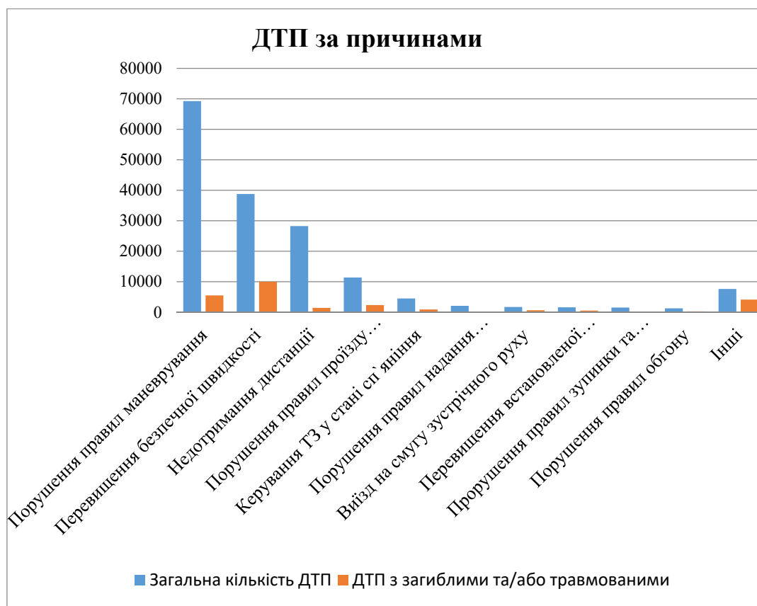
Рисунок 2 – ДТП за причинами

Уряд затвердив стратегію підвищення безпеки дорожнього руху до 2024 року. Метою цієї Стратегії є зниження рівня смертності внаслідок дорожньо-транспортних пригод щонайменше на 30 відсотків до 2024 року, зниження ступеня тяжкості наслідків дорожньо-транспортних пригод для учасників дорожнього руху та зменшення соціально-економічних втрат від дорожньо-транспортного травматизму, а також запровадження ефективної системи управління безпекою дорожнього руху для забезпечення захисту життя та здоров'я населення.